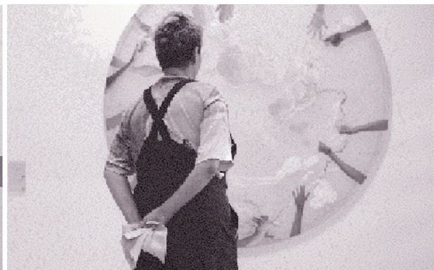
Aus der Serie „Die Reise nach Jerusalem“ von Almuth Baumfalk.